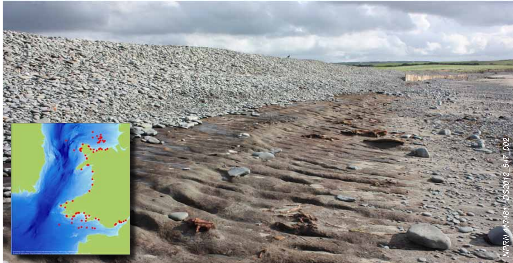
Uchod: Mae safleoedd Palaeolithig newydd yn cynnwys elfennau o hen dirweddau megis dyffrynnoedd afonydd a deltâu sydd wedi'u cadw yn adeiledd daearegol gwely'r môr, ynghyd â mwy na 60 o eangderau o goedwedd gynhanesyddol yn yr ardal rynglanw. Dangosir un enghraifft yma – mae'r gefnau o raeau bras yng nghefn y traeth wedi cilio yn Llanrhystud, Ceredigion, gan ddatgelu haen o fawn sy'n cynnwys bonion coed hynafol o'r cyfnod Mesolithig.

In 2007, the Royal Commission began a major new programme of research to extend the National Monuments Record of Wales (NMRW) to cover the UK's share of the Continental Shelf adjacent to Wales. Working in collaboration with the National Monuments Records of Ireland, Northern Ireland, England, Scotland and the Isle of Man, shipwrecks and other forms of underwater historic environment assets are now being recorded throughout the Irish Sea.