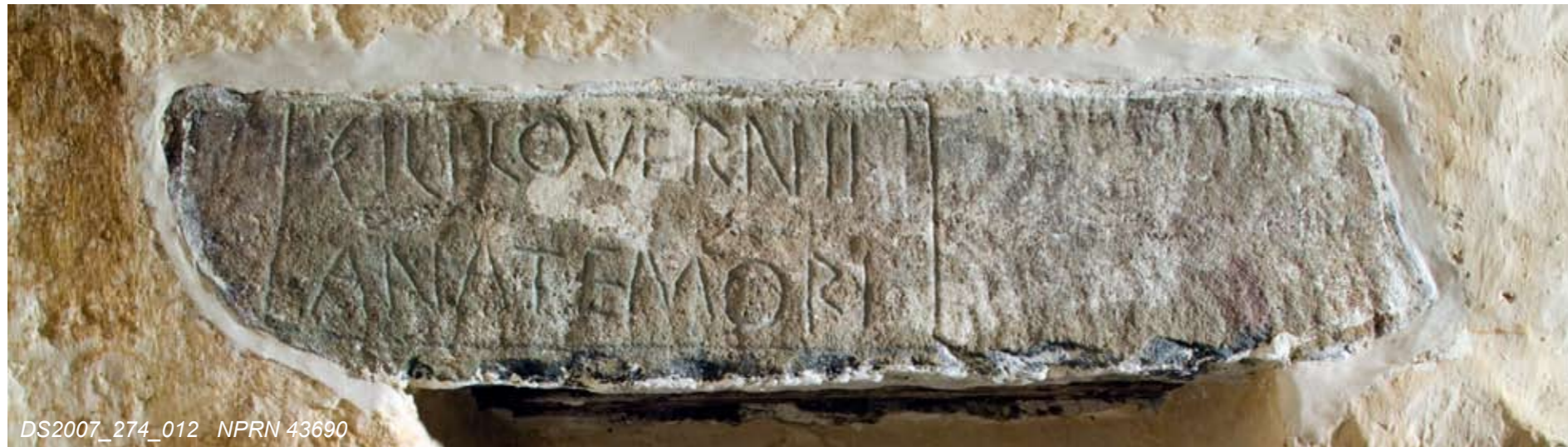
DS2007_274_012 NPRN 43690