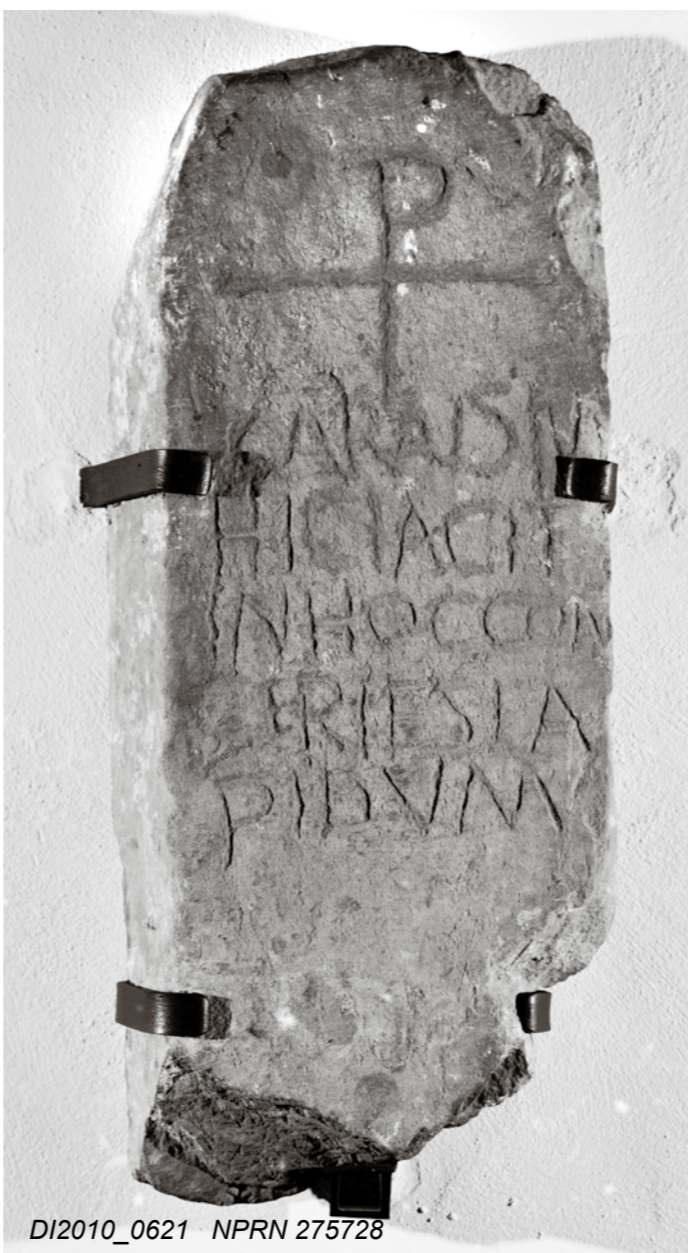
DI2010_0621 NPRN 275728