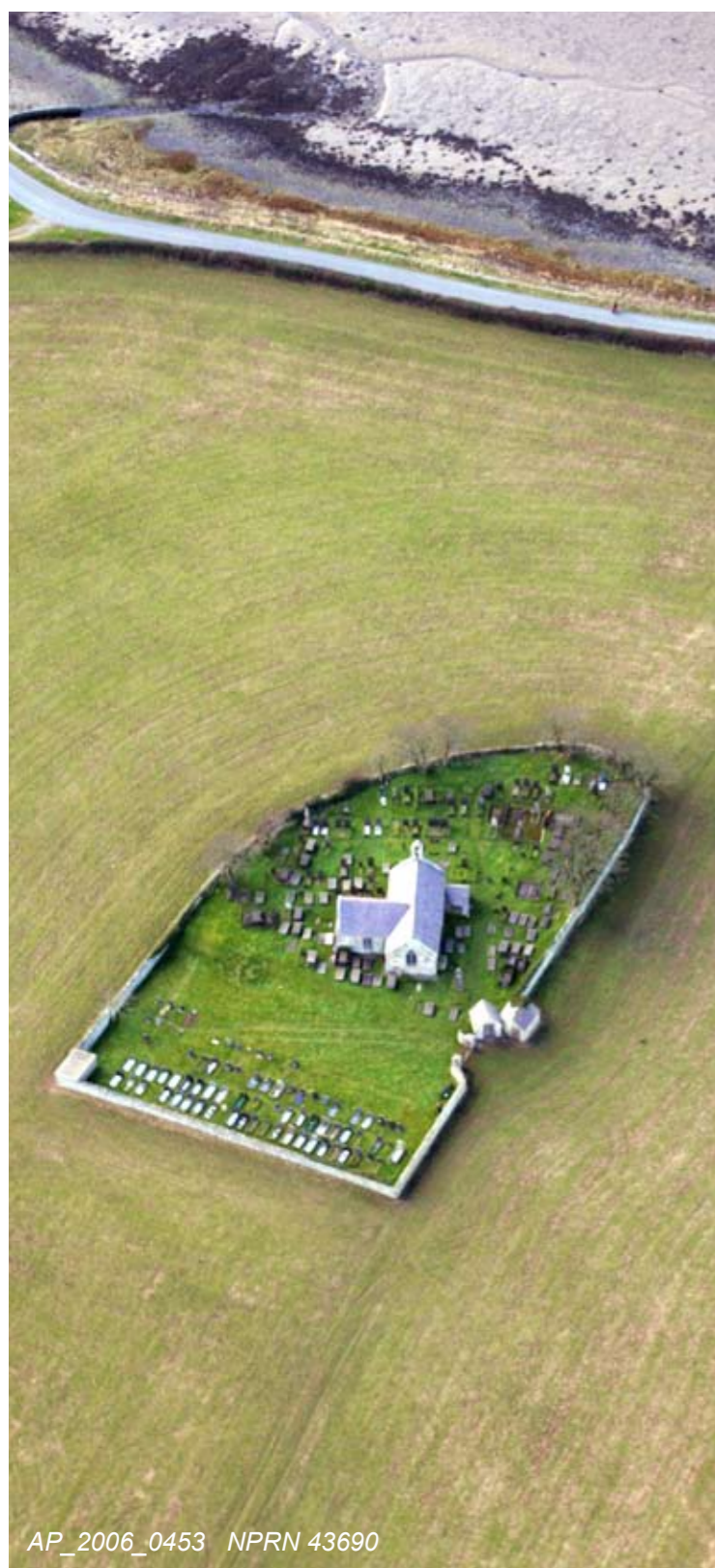
Chwith: Awyrlun o safle hynafol eglwys Sant Baglan, Llanfaglan.