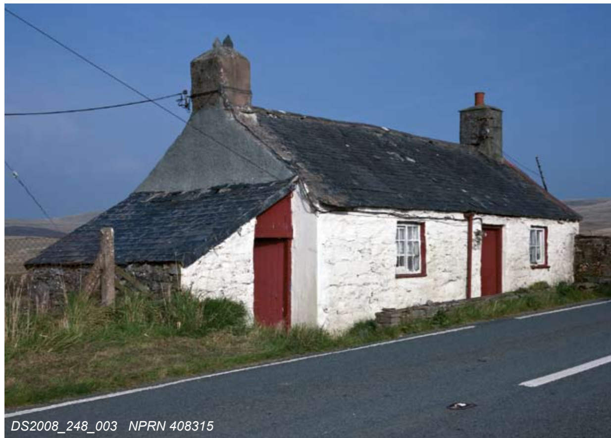
DS2008_248_003 NPRN 408315

Above: The earliest archaeological evidence for settlement on Hiraethog is this small group of flints found at the Aled Isaf reservoir. Many of these probably date from the Mesolithic period (c.10000 BC – c.4400 BC) but a few could be of later date.