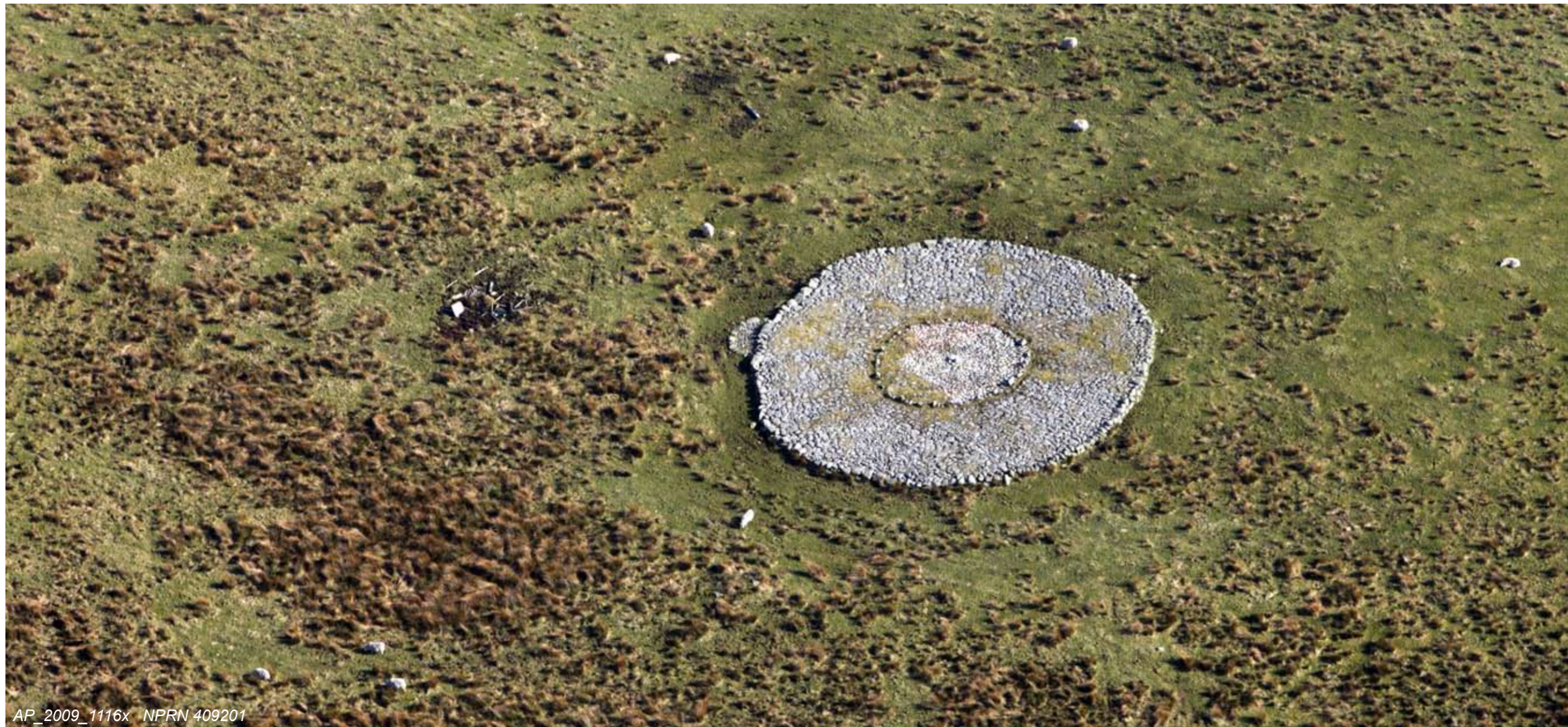
AP_2009_1116x NPRN 409201

Above: The summer settlement beside Nant Griafolen contained several simple huts, each with a single doorway and probably windowless. Middens, beside the huts, produced pottery and metal objects of the fifteenth and sixteenth centuries. This reconstruction is based on evidence from excavations.