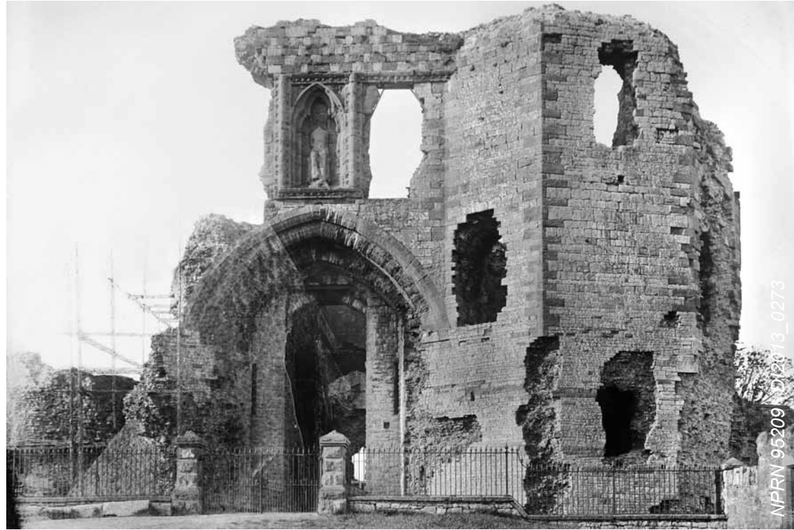
Chwith: Gweddillion y porthdy enfawr gyda thri thŵr. Ystyrir mai'r porthdy hwn, a oedd yn ganolbwynt trawiadol i'r ffasâd, yw un o'r rhai gwychaf a adeiladwyd erioed.