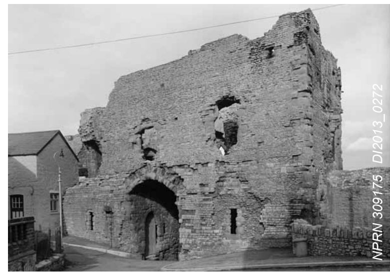
Chwith: Cafodd mwy na hanner milltir o furiau tref eu codi ochr yn ochr â'r castell i amddiffyn y rheiny a oedd wedi ymsefydlu yn y fwrdeistref Seisnig. Roedd y rhain yn cynnwys Porth Burgess.