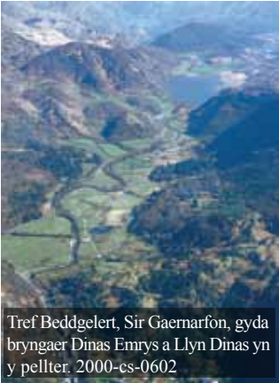
Tref Beddgelert, Sir Gaernarfon, gyda bryngaer Dinas Emrys a Llyn Dinas yn y pellter. 2000-cs-0602