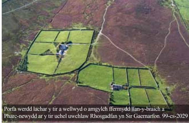
Porfa werdd lachar y tir a wellwyd o amgylch ffermydd Tan-y-braich a Pharc-newydd ar y tir uchel uwchlaw Rhosgadfan yn Sir Gaernarfon. 99-cs-2029