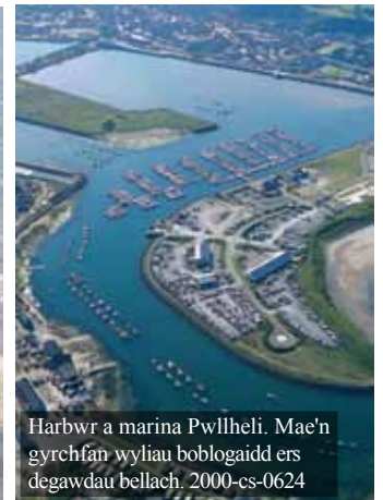
Harbwr a marina Pwllheli. Mae'n gyrchfan wylliau boblogaidd ers degawdau bellach. 2000-cs-0624