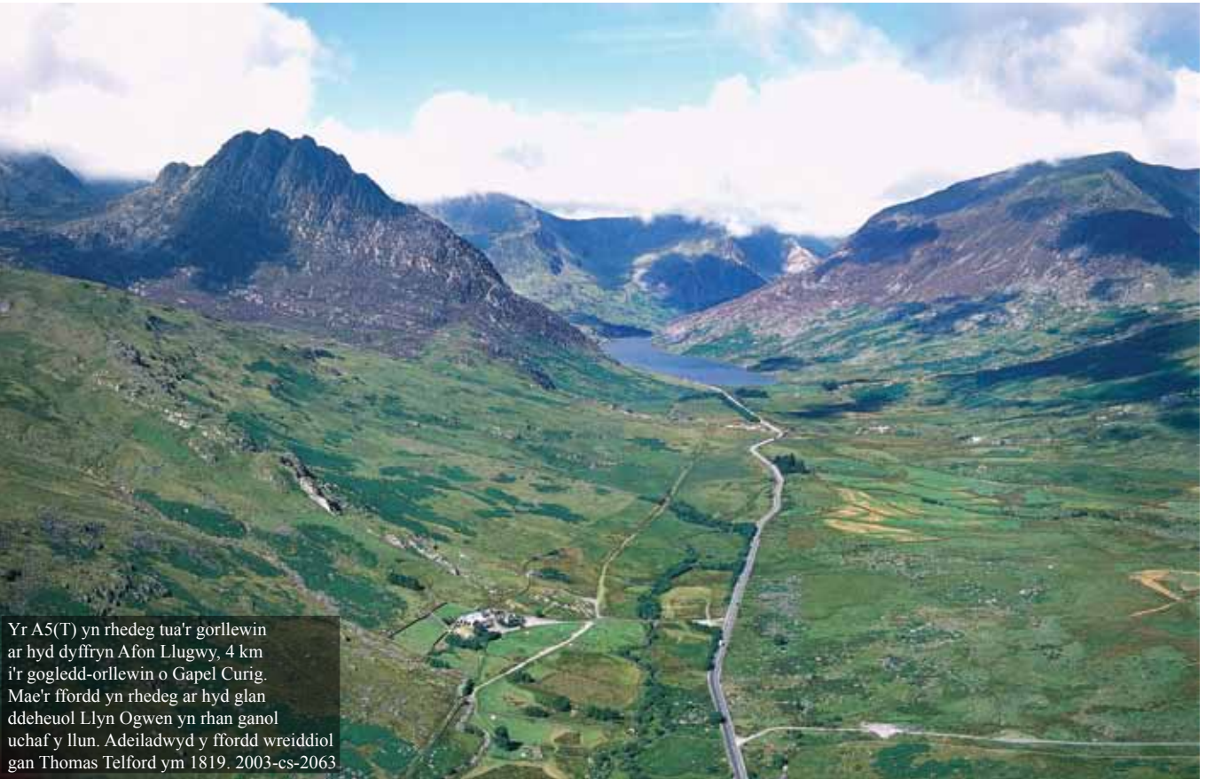
Yr A5(T) yn rhedeg tua'r gorllewin ar hyd dyffryn Afon Llugwy, 4 km i'r gogledd-orllewin o Gapel Curig. Mae'r ffordd yn rhedeg ar hyd glan ddeheuol Llyn Ogwen yn rhan ganol uchaf y llun. Adeiladwyd y ffordd wreiddiol gan Thomas Telford ym 1819. 2003-cs-2063