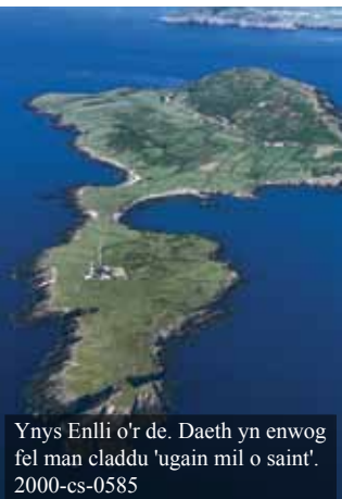
Ynys Enlli o'r de. Daeth yn enwog fel man claddu 'ugain mil o saint'. 2000-cs-0585